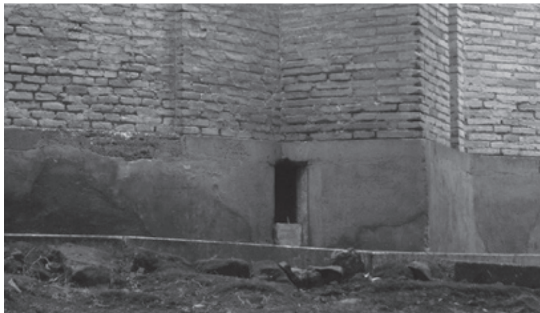
◀ 保羅傳遞書信的小洞